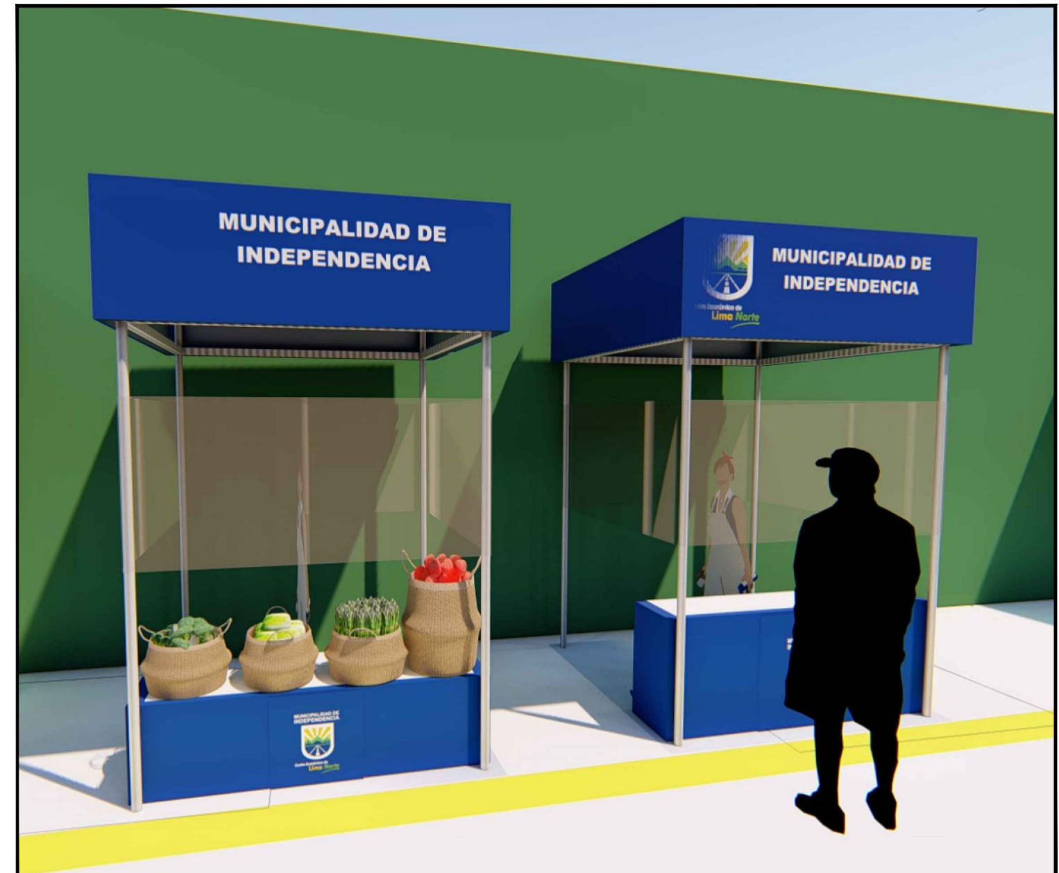
PROTOTIPO DE MÓDULOS 2m x2m