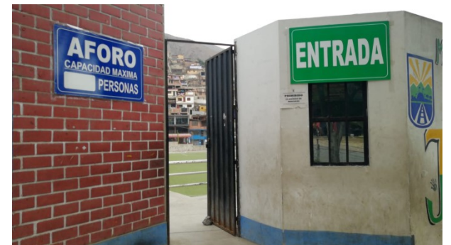
Imagen 04: Señalización de Aforo