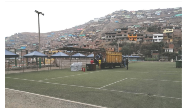
Imagen 03: Habilitación Espacio