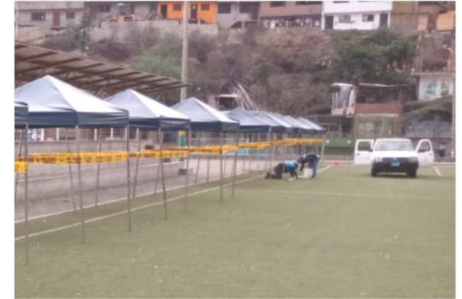
Imagen 02: Trazado