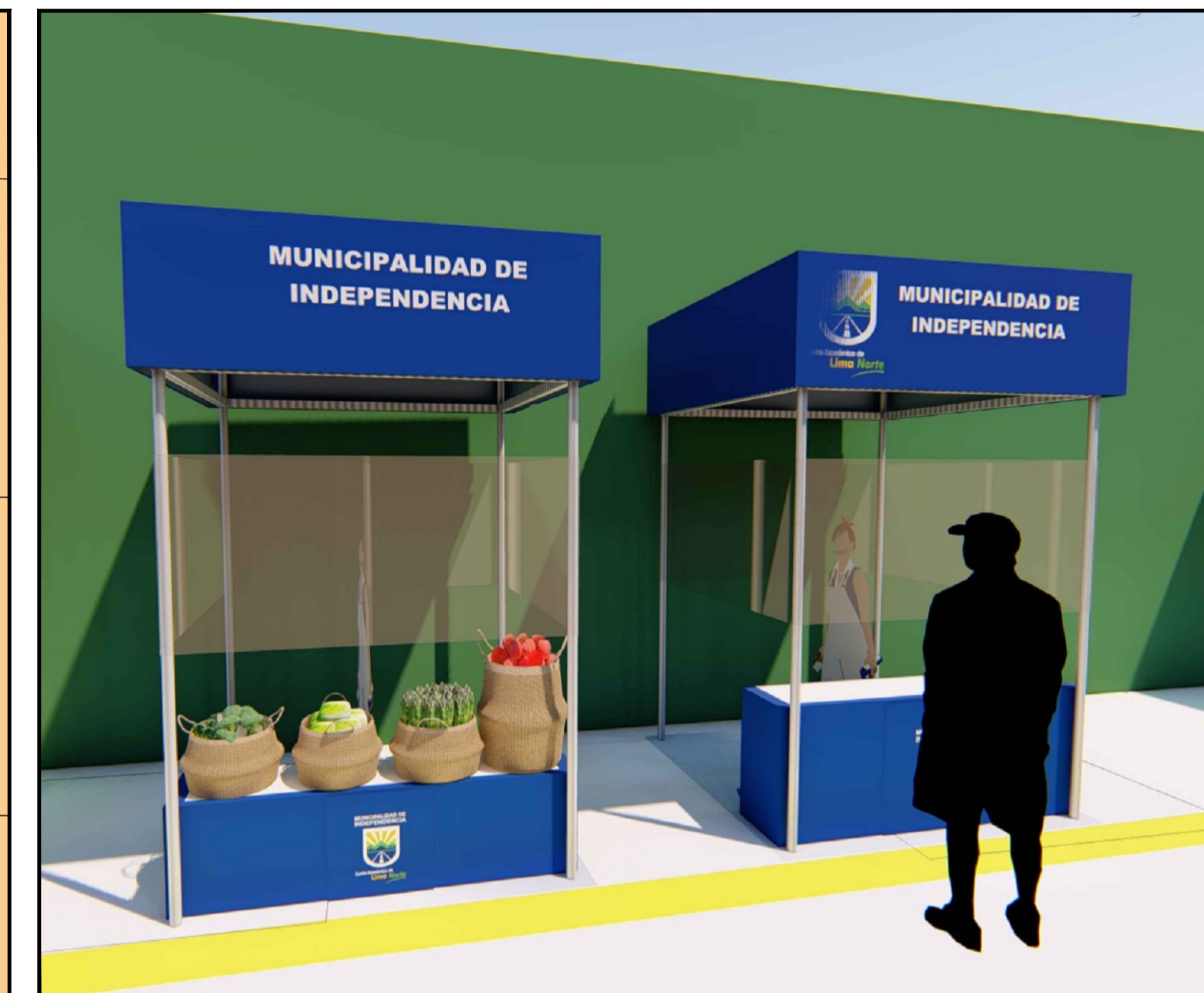
PROTOTIPO DE MÓDULOS 2m x2m