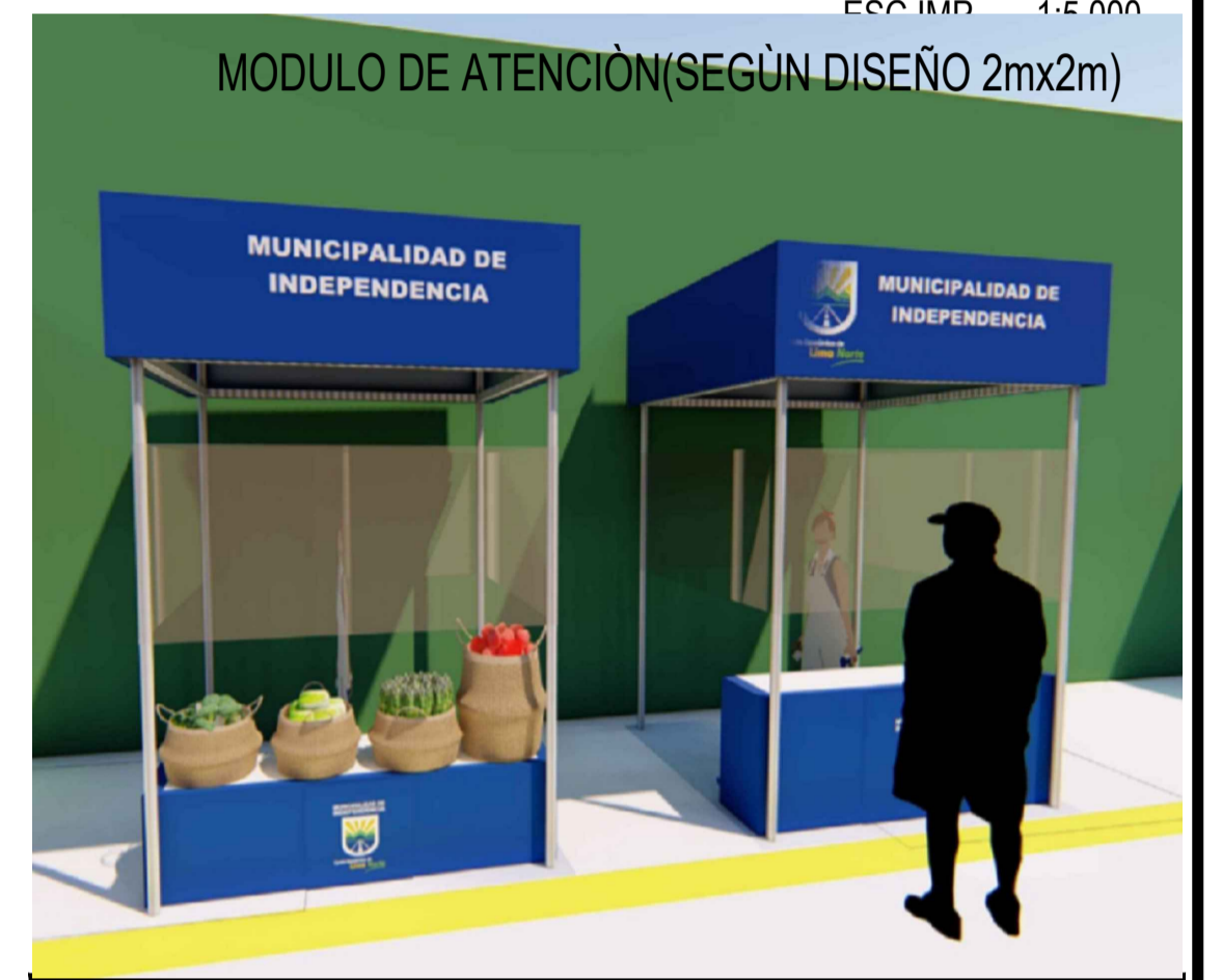
DESCRIPCIÓN DEL PROYECTO