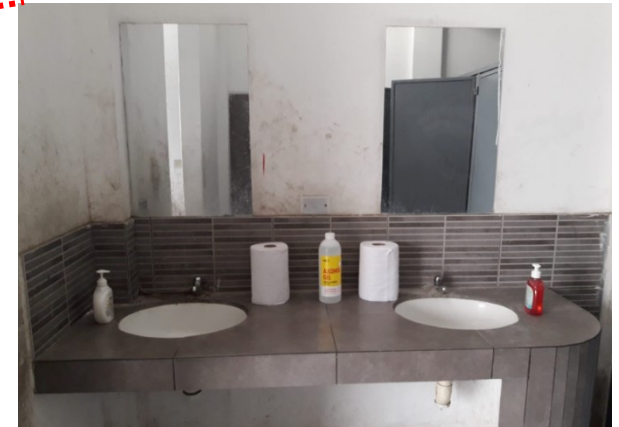
Imagen 03: lavabo