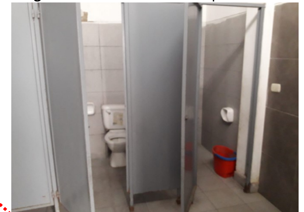
Imagen 04: Inodor .