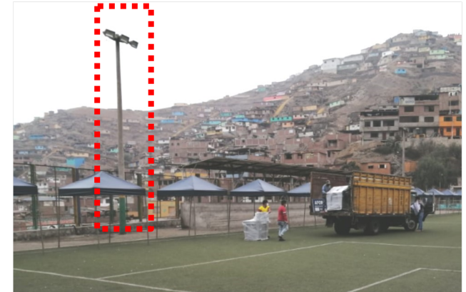
Imagen 02: Iluminación