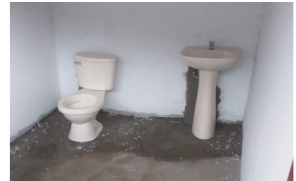
Imagen 03: Inodoro/lavabo