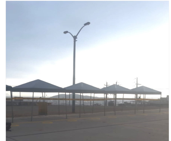
Imagen 02: Iluminación