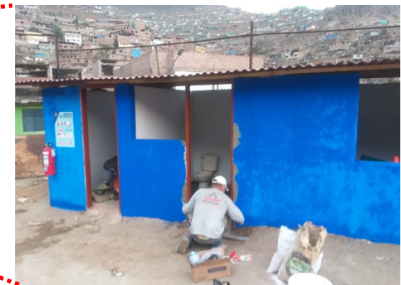
Imagen 04: SS.HH.